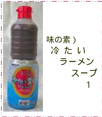
味の素) 冷たい ラーメン スープ 1