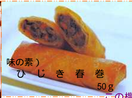
味の素) ひじき春巻 50g