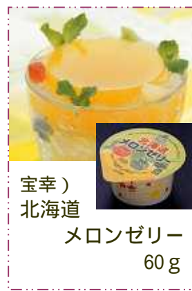
宝幸) 北海道 メロンゼリー 60g