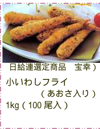
日給連選定商品 宝幸) 小さいわしフライ (あおさ入り) 1kg(100尾入)