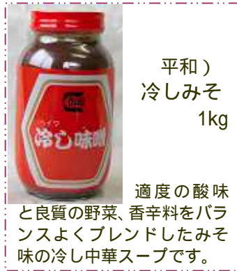
平和) 冷しみそ 1kg

適度の酸味 と良質の野菜、香辛料をバラ ンスよくブレンドしたみそ 味の冷し中華スープです。