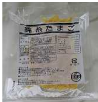
みやけ) 錦糸卵 250g