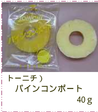
トーニチ) パインコンポート 40g