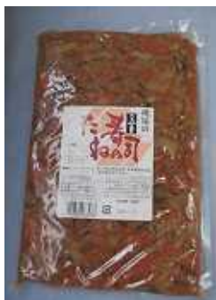
桃屋) 五目寿司のもと 1kg

備前岡山藩藩主の池田光政が、汁物以外に副食を一品に制限する「一汁一菜令」を布告した事が、岡山名物のばらすしが生まれ背景となっていることから、池田光政の命日である6月27日を「ちらし寿司の日」として日本記念日協会が制定した。