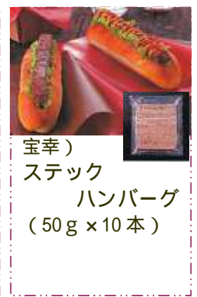
宝幸) ステーキ ハンバーグ (50g x 10本)