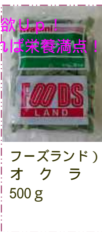
フーズランド) オクラ 500g