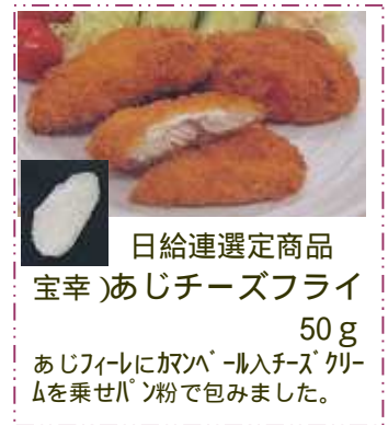
日給連選定商品 宝幸)あじチーズフライ 50g あじフィレに甘辛パルチンクリームを乗せパン粉で包みました。

適度の酸味 と良質の野菜、香辛料をバラ ンスよくブレンドしたみそ 味の冷し中華スープです。