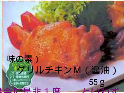
味の素) グリルチキンM(醤油) 55g