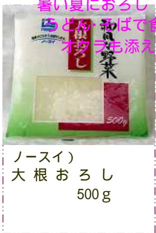
ノースイ) 大根おろし 500g