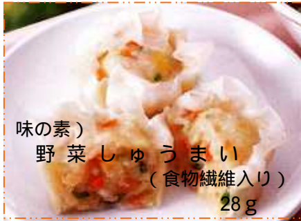
味の素) 野菜しゅうまい (食物繊維入り) 28g