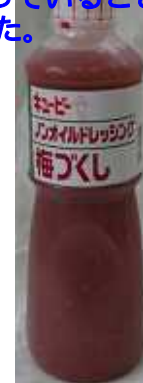
QP) ノンオイル ドレッシング 梅づくし 1