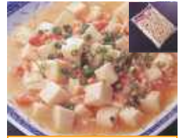
大冷) 冷凍豆腐 サイコロカット 1kg