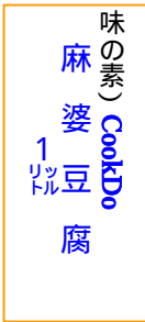
味の素) 麻婆豆腐 1リットル