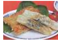
ニホサンクス) しそ巻き 棒餃子 23g