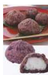
Q.P) 十勝おはぎつば (つばあん) 35g