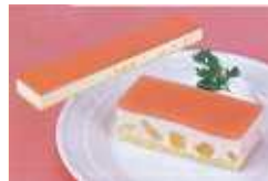
フレック) フリーカットケーキ (白桃ムース) 550g