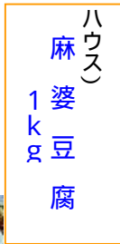
ハウスの 麻婆豆腐 1kg