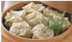
宝幸) 和しゅうま (本わさび風味) 30g