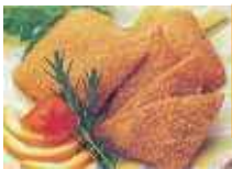
大冷) ハムカツ 50g

3月13日、2個の3が1を挟んでいる事から決められました。また「サンド(砂)とウィッチ(魔女)」以外は何でも挟んで食べれる万能メニューという説もあります。