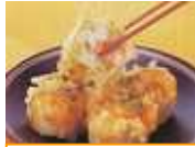
味の素) 豆腐と彩り 野菜しゅうまい 27g