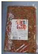
桃屋) 五目寿司 のたね 1kg