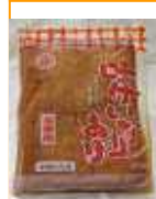
まるよね) いなり味付 SR(40枚入)