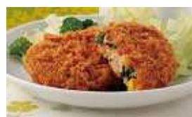
ちぬや) 菜の花コロック 50g 4月までの季節商品