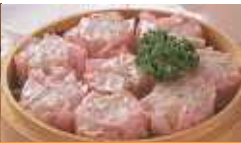
宝幸) 和しゅうまい (梅しそ入り) 30g