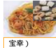
宝幸) シーフード ドミックス 1kg