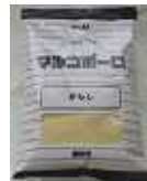
SB) マルコポーロ からし 300g