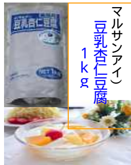
マルサンアイ) 豆乳杏仁豆腐 1kg