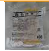
みやげ) 錦糸卵 300g