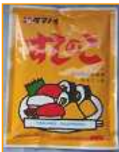
タマノイ) すしのこ 150g