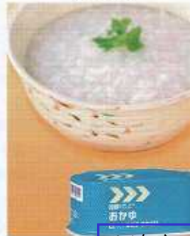
イメージ写真 24缶入