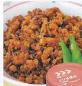
イメージ写真 24缶入