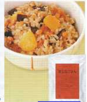
イメージ写真 24缶入