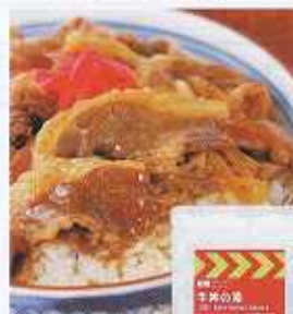
イメージ写真 24袋入