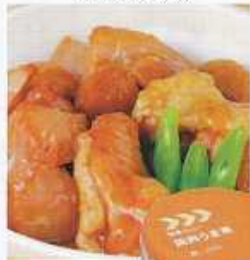
イメージ写真 24缶入