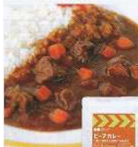
イメージ写真 24袋入