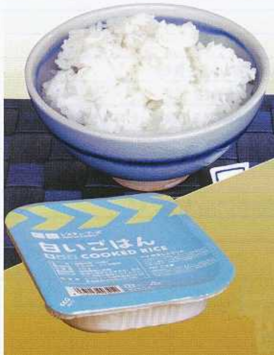
白いごはん 長期保存が可能な アルミトレーパックごはん 24パック入