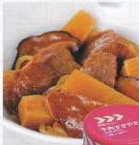
イメージ写真 24缶入