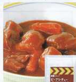
イメージ写真 24袋入