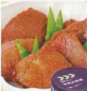
イメージ写真 24缶入