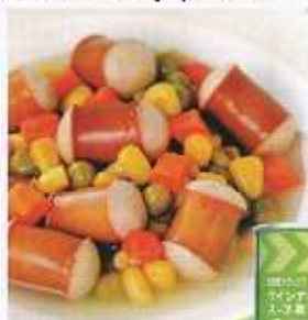
イメージ写真 24缶入