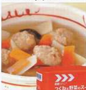
イメージ写真 24缶入