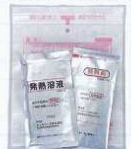
発熱剤を利用することで 温めることができます。