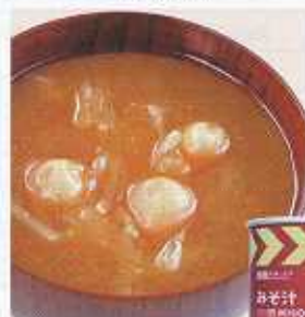
イメージ写真 24缶入