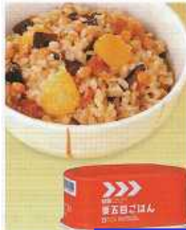
イメージ写真 24缶入